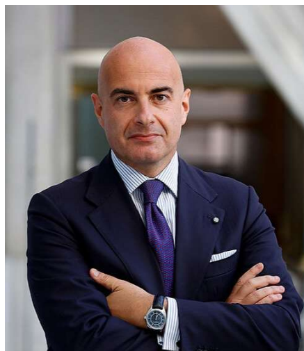
Dante Brandi, Ambasciatore d'Italia a Singapore e Brunei Darussalam

La promozione e l'assistenza alle imprese italiane impegnate nei mercati esteri costituiscono uno dei pilastri dell'azione della rete diplomatica e consolare nell'ambito del sostegno al Sistema Paese. Grazie alla loro conoscenza approfondita del contesto politico, economico e normativo dei Paesi di accreditamento, le Ambasciate rappresentano interlocutori privilegiati per le aziende che intendono sviluppare progetti di internazionalizzazione o avviare attività d'investimento all'estero. L'intera rete diplomatico-consolare contribuisce, attraverso iniziative coordinate di promozione commerciale, a facilitare l'accesso delle imprese italiane ai mercati globali, sostenendo la crescita dell'economia nazionale e la sua integrazione nelle principali catene del valore internazionali.