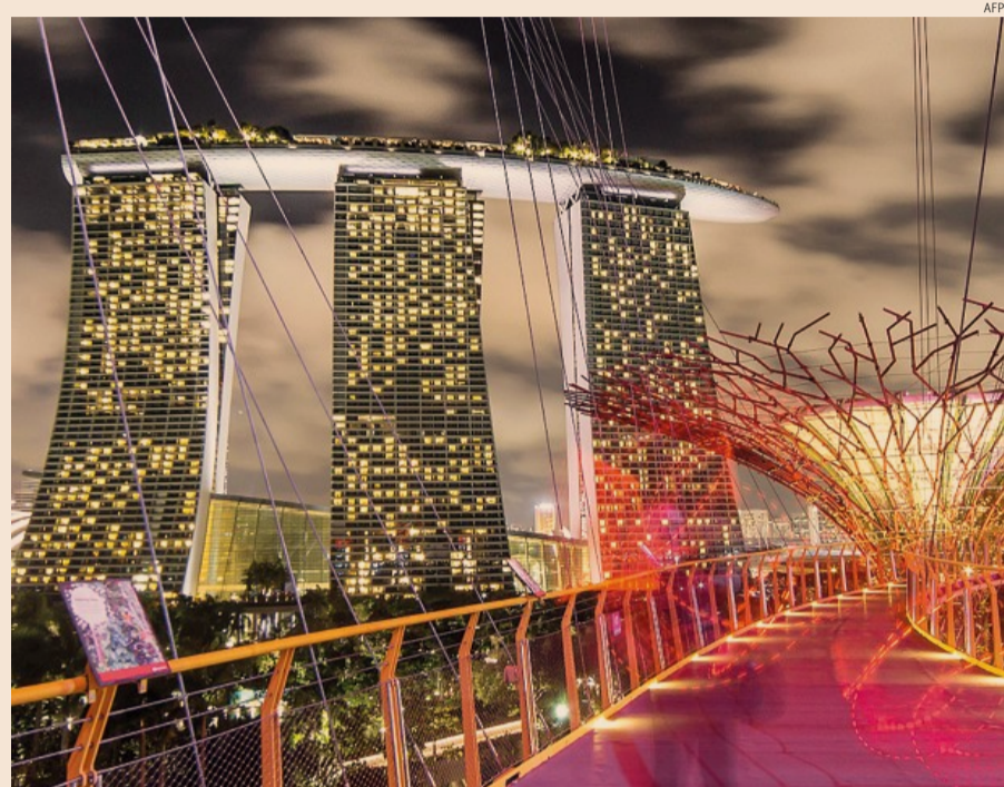
A un passo dal futuro. Il complesso Marina Bay Sands di Singapore visto dai Gardens by the bay

Le strade che si intrecciano nel campus di One North sono tra le poche al mondo sulle quali è autorizzata la sperimentazione di veicoli senza autista (non è un caso, a Singapore ordine e rispetto delle regole, anche della strada, sono compulsivi). Quattro soggetti, compresa A-Star, sono in concorrenza con quattro tecnologie diverse. Nel 2016, nuTonomy, società fondata da due ricercatori del Massachusetts In-